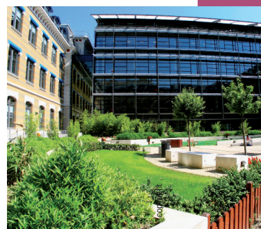
Université Jean Moulin Lyon 3

2 rue du 23 e Régiment d'Infanterie 01000 Bourg-en-Bresse Standard ☎ 04 74 23 82 30