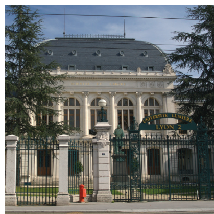
Serge Tanet / Université Lumière Lyon 2

4 bis rue de l'Université 69365 Lyon cedex 07 Standard ☎ 04 78 69 70 00