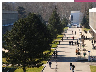
Université Lyon 1 - Campus de la Doua

8 avenue Rockefeller 69373 Lyon Cedex 8 Standard ☎ 04 78 77 70 00