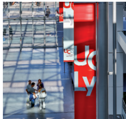
Institut catholique de Lyon