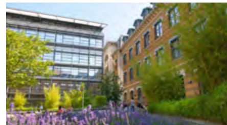
© Université Jean Moulin Lyon 3 - La Manufacture des Tabacs